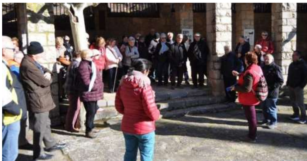
Escoltant les explicacions sobre la vida del Pare Palau.