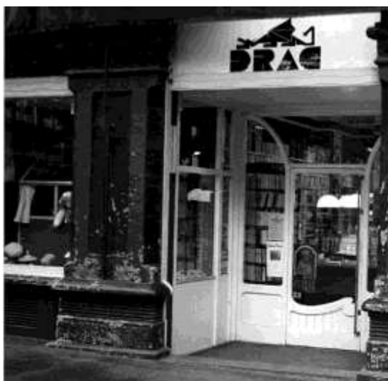
La llibreria Drac d'Olot

Inici dels anys setanta. Olot centre. Un edifici modernista, amb ferro forjat i balconada de fantasia: la casa Gaietà Vila. Als baixos de l'edifici hi penja el rètol amb el nom d'una llibreria: Drac.