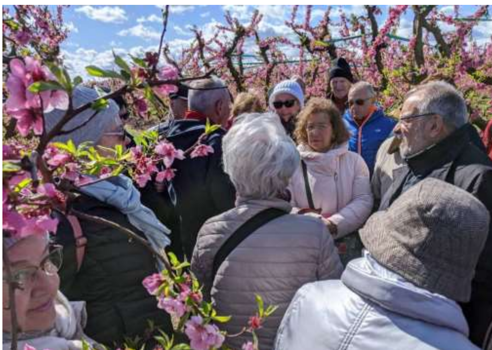
Escollant les explicacions d'en Josep.