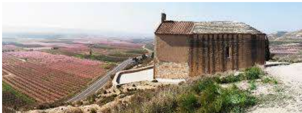
L'ermita i mirador de Sant Joan de Carratalà.